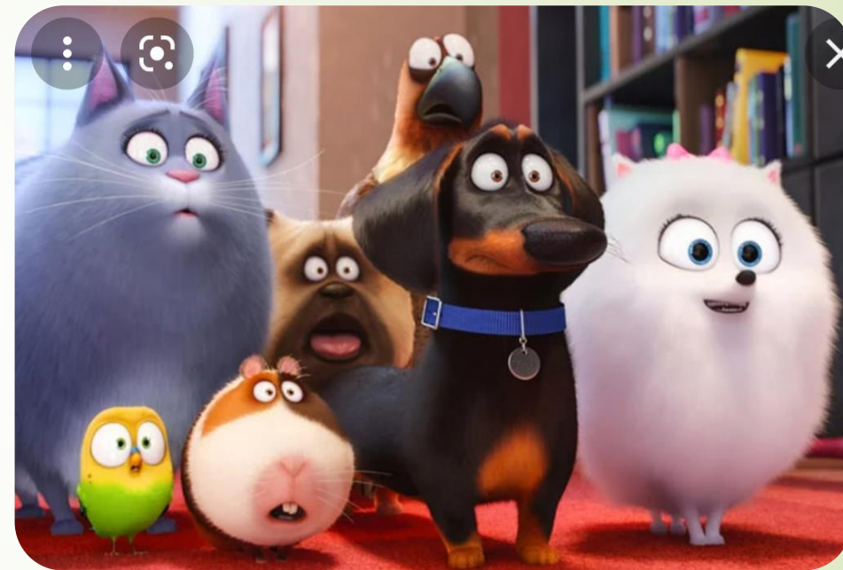
پتر ۱ و ۲