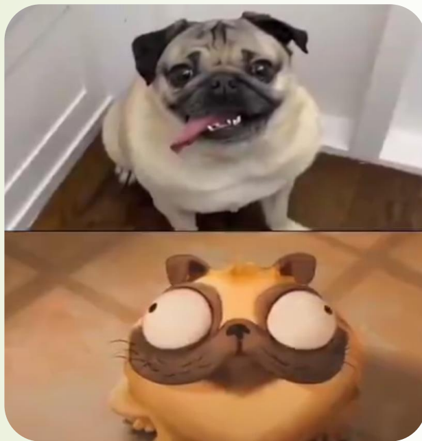
میچل ها علیه بیگانگان